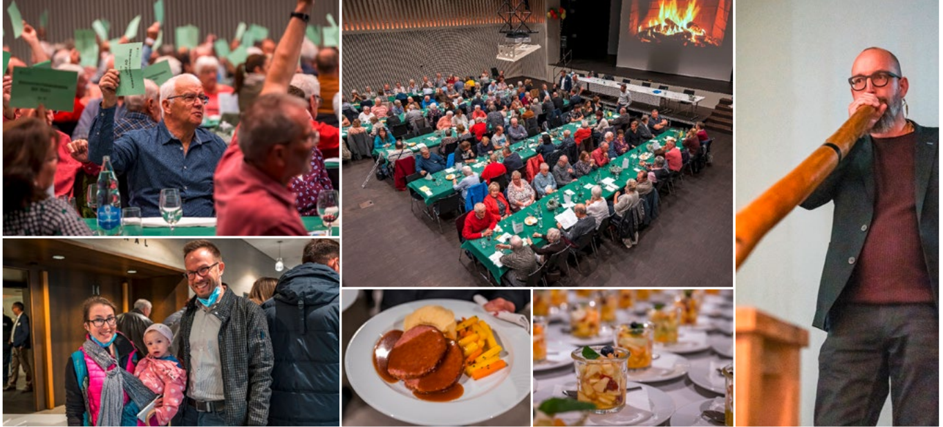
Impressionen von der 92. ordentlichen Generalversammlung.