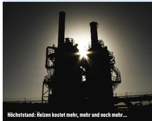
Höchststand: Heizen kostet mehr, mehr und noch mehr...

JA – erhöhen Sie freiwillig die Heiz- und Betriebskosten-Akontozahlung und Sie werden die positive Auswirkung im Folgejahr sehen.